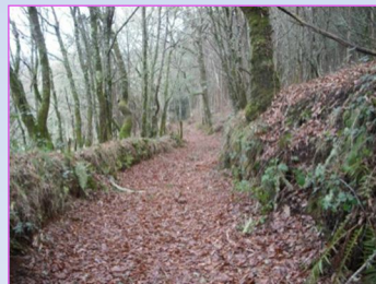
5. Camiño entre balados