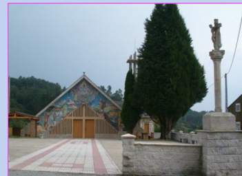
2. Igrexa Santo André de Lousada