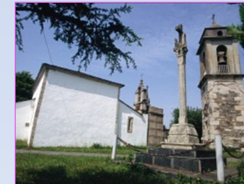
8. Igrexa de San Pedro Fiz