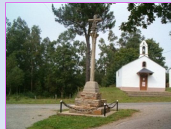
6. Capela do Campo