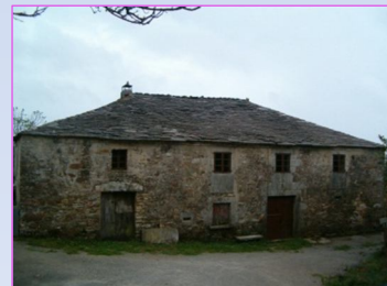
4. Pousada de Pepa a Loba