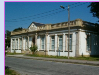
7. Escola Habaneira