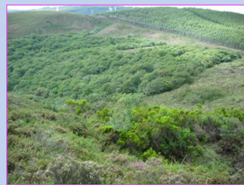
1. Neveira e Fraga da Lagoa