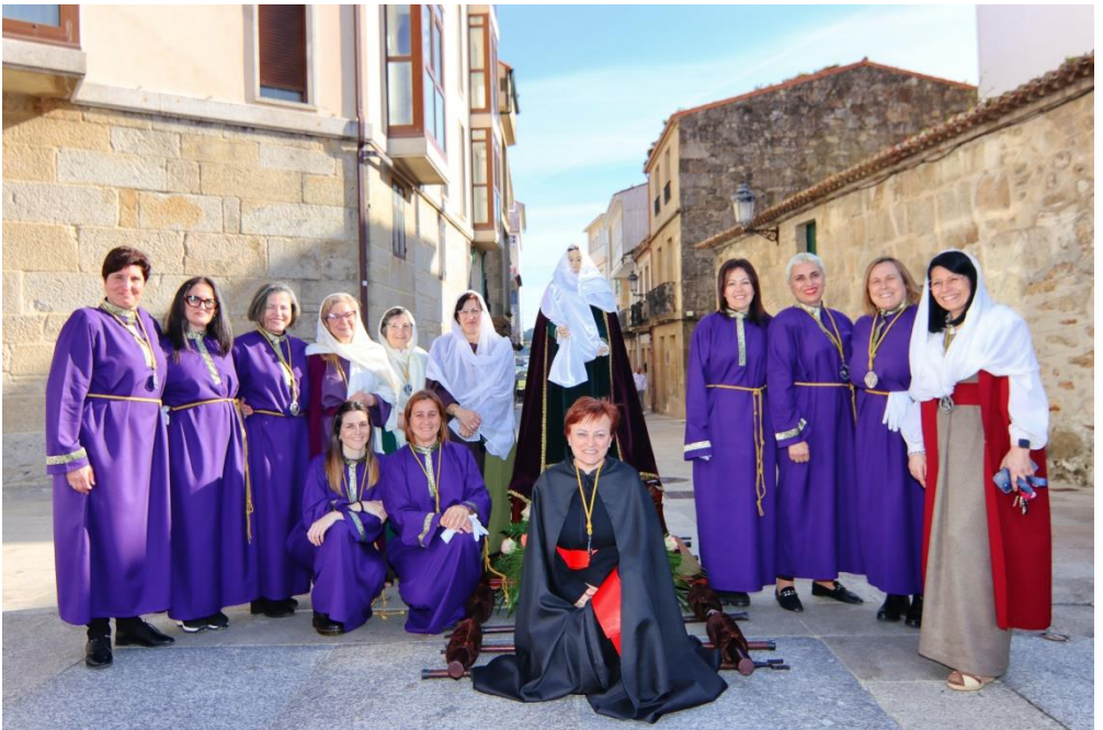
Porteadoras de La Verónica. Santo Encuentro 2023