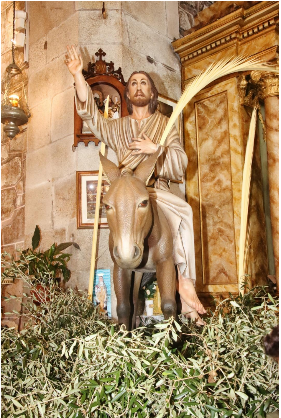
Domingo de Ramos, 2023