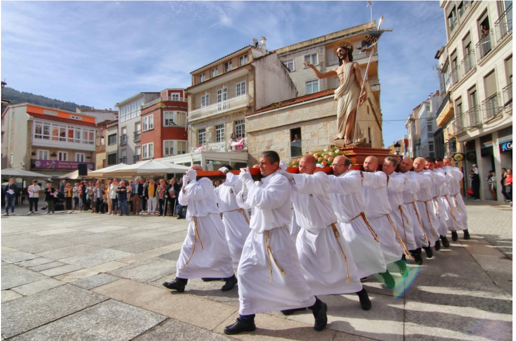
Encuentro Domingo de Resurrección 2023