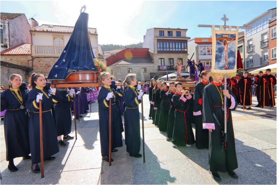
Procesión Santo Encuentro 2023