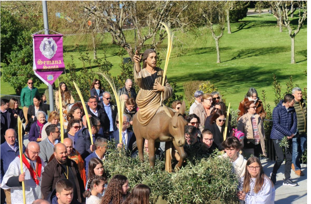
Domingo de Ramos 2023