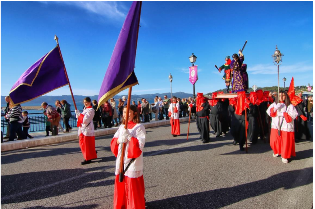
Jueves Santo 2023. Procesi3n del Ecce-Homo