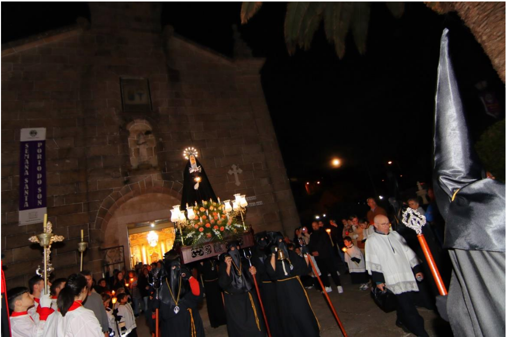
Procesión Virgen de la Soledad 2023