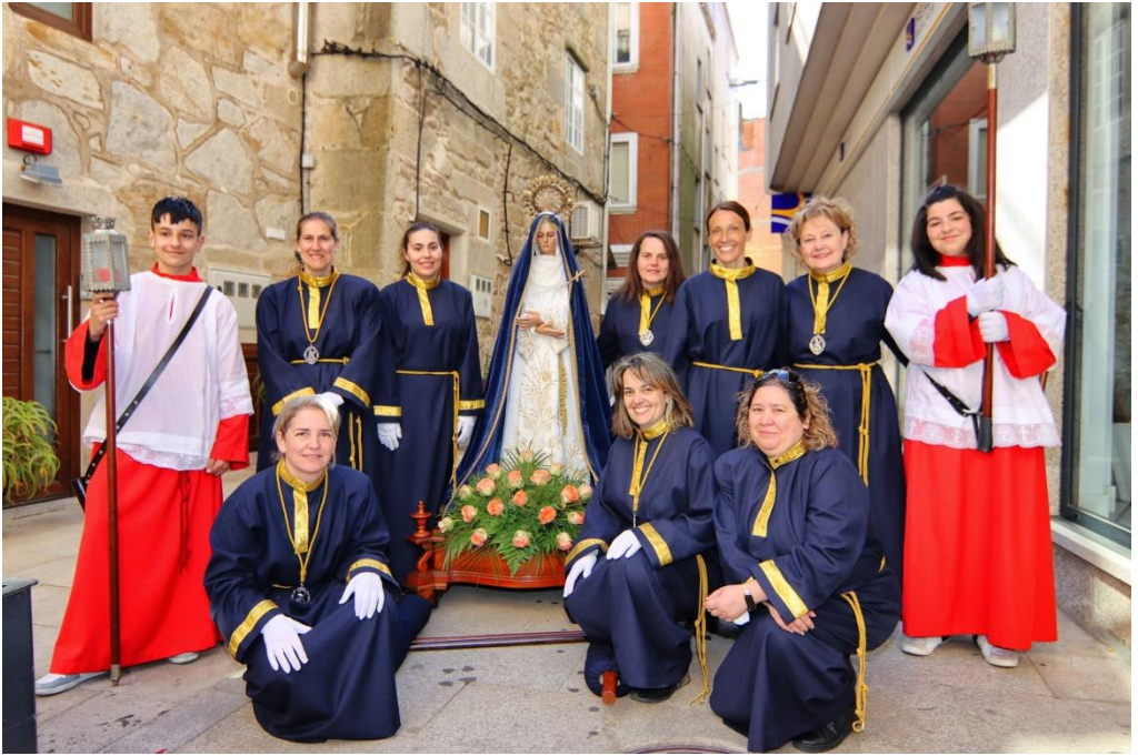
Porteadoras de la Virgen de los Dolores. Santo Encuentro 2023