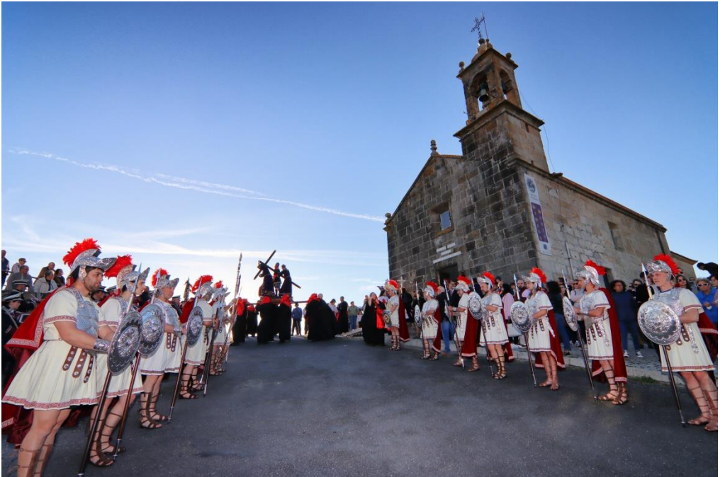
Jueves Santo 2023. Procesi3n del Ecce-Homo