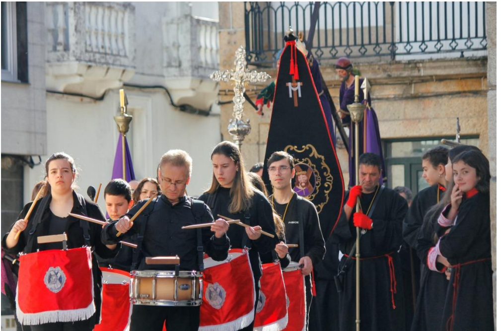
Santo Encuentro 2023