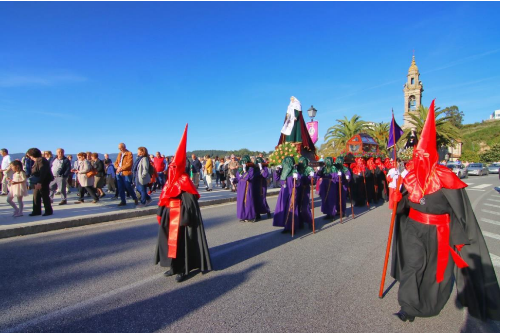
Procesión Santo Entierro 2023