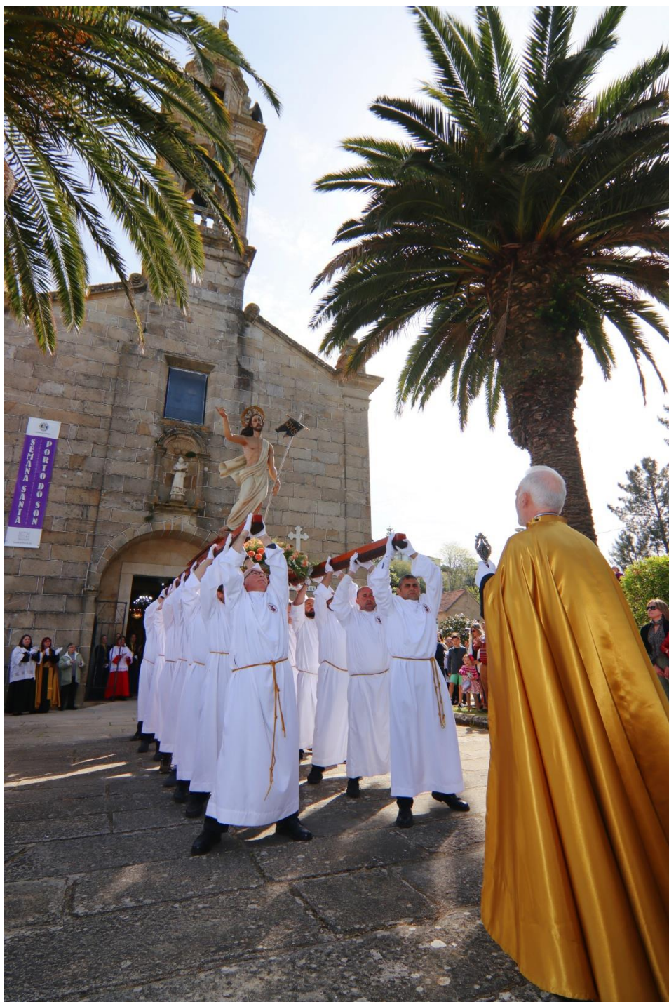
Procesión Domingo de Resurrección 2023