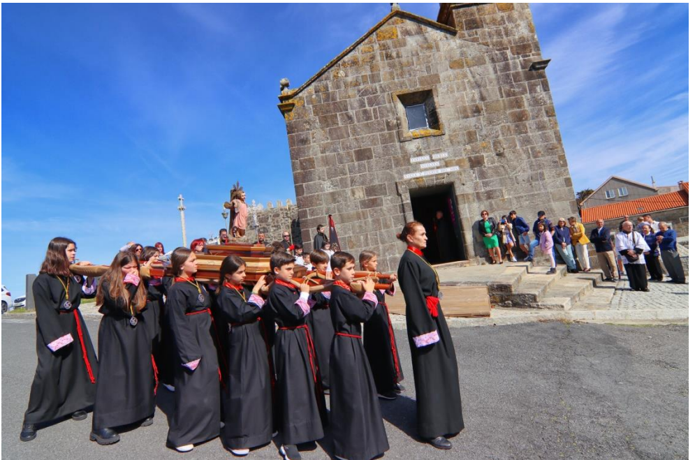
Procesión Santo Encuentro 2023