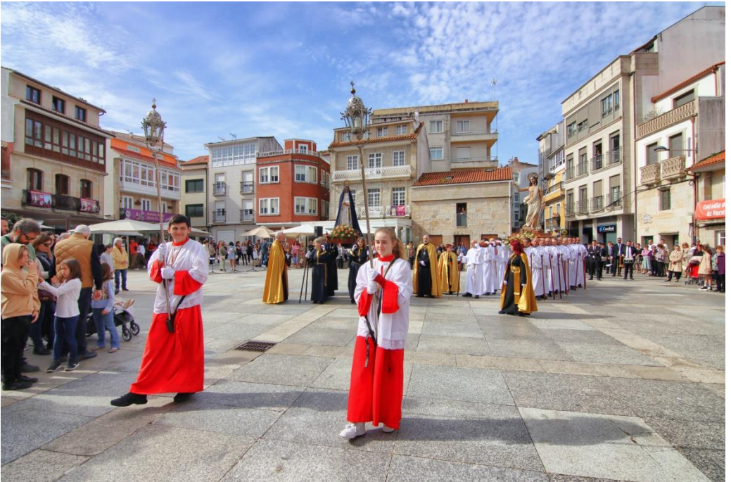
Encuentro Domingo de Resurrección 2023