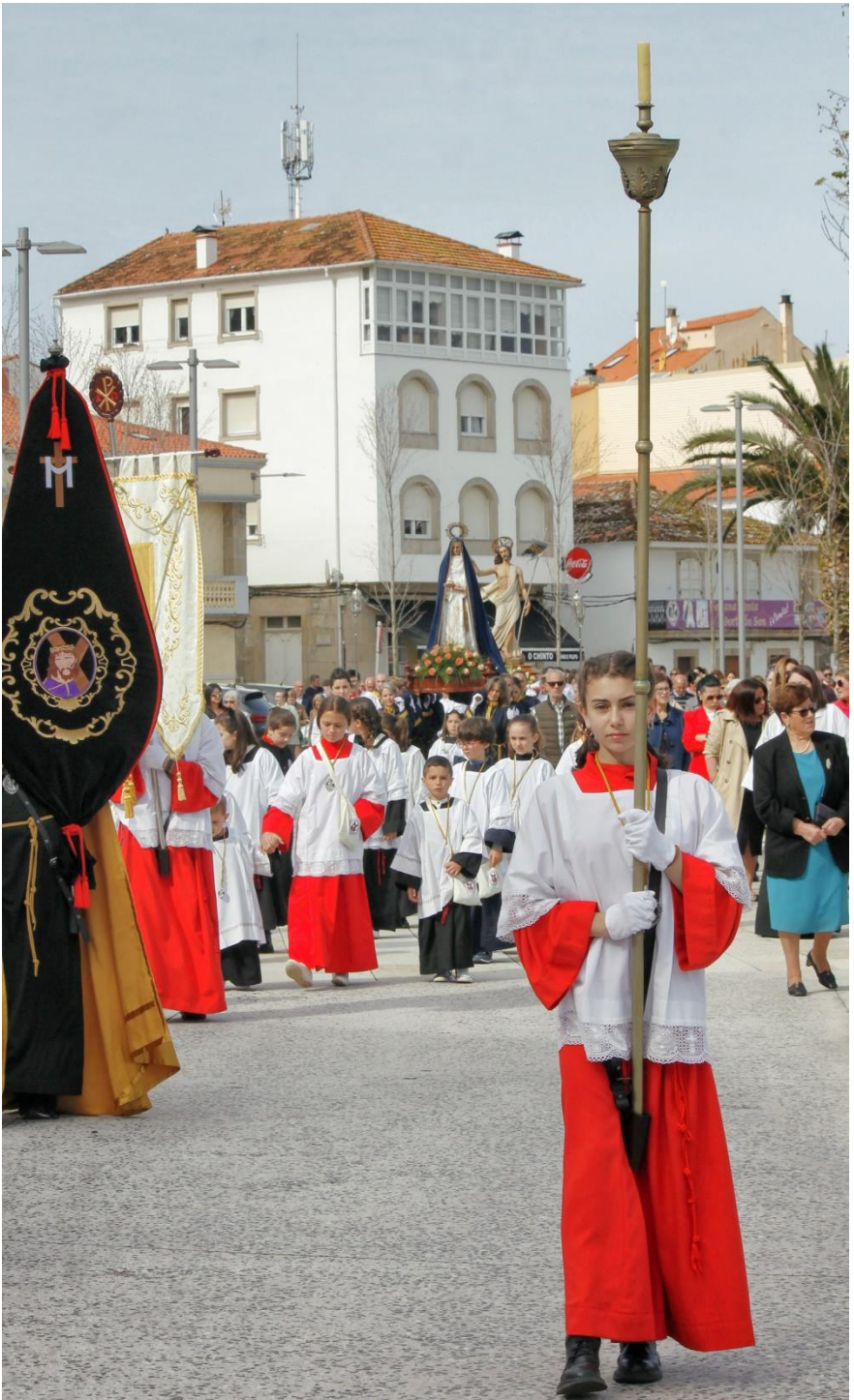
Procesión Santo Encuentro 2023