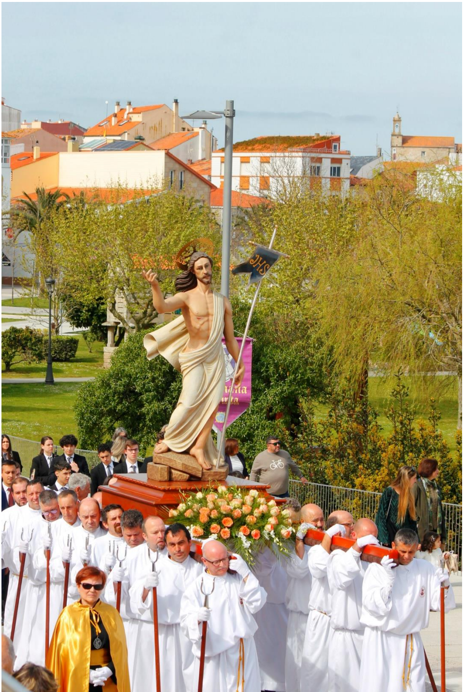
Procesión Domingo de Resurrección 2023