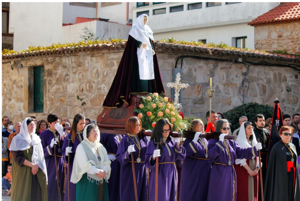
Santo Encuentro 2023