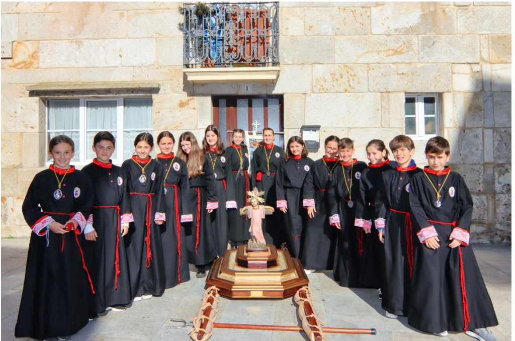
Porteadores del Niño Jesús en la Cruz, Santo Encuentro 2023