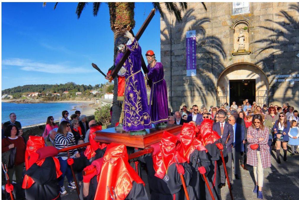
Jueves Santo 2023, Procesi3n del Ecce-Homo