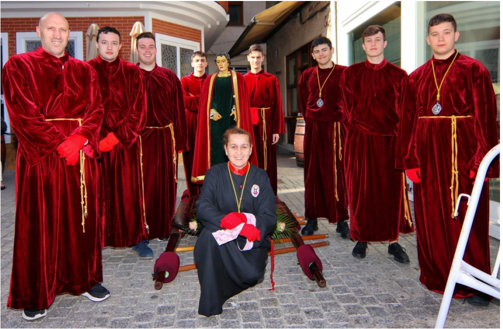
Porteadores San Juan. Santo Encuentro 2023