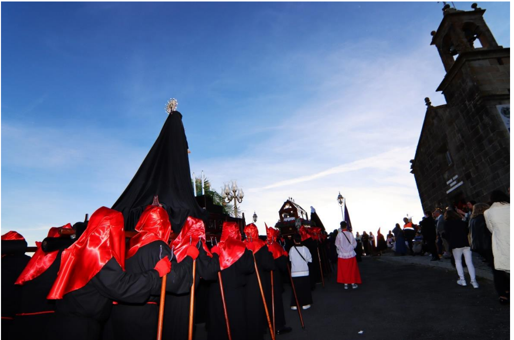
Procesión Santo Entierro 2023