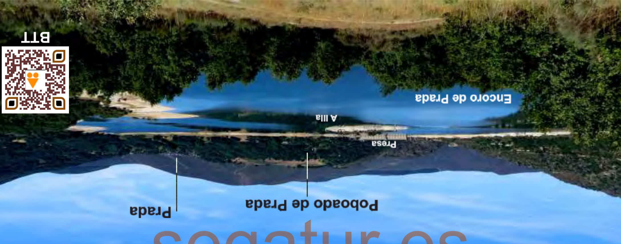
O pombal de Castromarigo

PR-G 211 Senda Verde do Xares. Partindo dende a poboación da Veiga iniciamos o percorrido pola beira dereita do río Xares ata a presa de Prada (pasando por Casdenodres, Castromarigo e