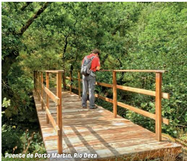
Puente de Porto Martín. Río Deza