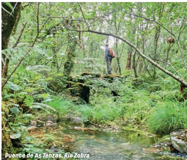
Puente de As Tenzas. Río Zobra