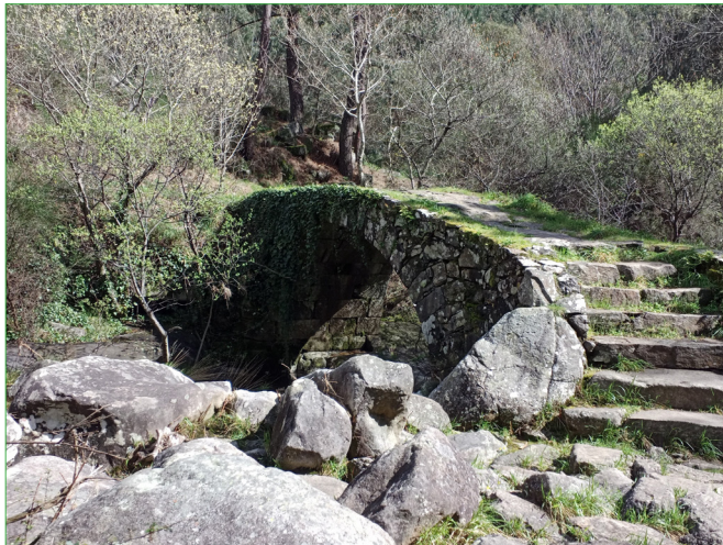
Puente de San Xoán da Misarela

El camino continúa descendiendo a través de un sendero hasta el mirador de Valle Inclán donde se encuentra una escultura del ilustre escritor, con gran arraigo en A Pobra do Caramiñal. Desde el mirador podemos bajar hasta Aldea Vella entre plantaciones forestales por la variante de este PR-G.