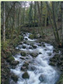
Regato do Batán