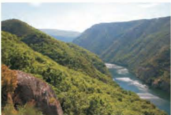
Canón do Sil dende o miradoiro da Galiña