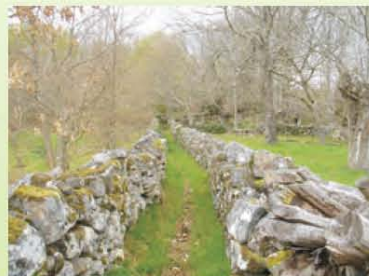
"Carriozas" en Fondodevila