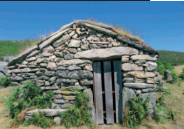
Detalle de la puerta de entrada al Chozo de Cernadas

Desde Avión, podemos llegar por dos carreteras, ya sea por Nieva o por Abelenda. Si elegimos el primer itinerario, debemos desviarnos de la carretera OU-212 en dirección a Nieva a la altura de Sifón. Si elegimos el segundo trayecto, en la misma carretera, deberemos coger el desvío en dirección a Abelenda. Las dos están perfectamente señalizadas.