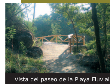
Vista del paseo de la Playa Fluvial

Partiendo de Avión, tenemos que desviarnos de la carretera OU-212 en dirección a la playa fluvial, donde encontraremos dos rutas: una que parte desde muy cerca de la casa de turismo rural, antigua fábrica de cuero (Ruta de Valderías) y otra al lado del puente (Ruta do Castro).