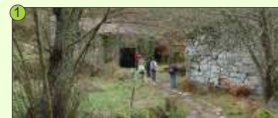
1 Muíño da Cebola - Desvianndonos do camiño uns 200m e regueiro enriba atopamos o vello muíño.

Allariz conta con máis de 100 km de rutas aptas para realizar actividades de sendeirismo ou bicicleta, válidas para calquera nivel. Os camiños permiten gozar de contornos á beira do río, así como na montaña dende onde se divisa o val do Arnoia.