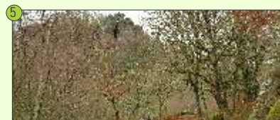
5 Tumbas e Castelo