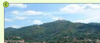
4 Monte Penamá - A man dereita existe unha pista de forte desnivel que leva á cima do monte Penamá a 985m de altitude.