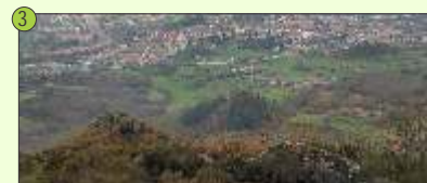
3 Vista Panorámica - Ao longo do camiño atoparemos interesantes lugares para tomar vistas panorámicas, entre elas esta do vale e da Vila de Allariz.