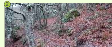
2 Ruta Corta - Tomando esta variante o camiño transcorre polo medio dun bosque, catalogado como zona núcleo da Reserva da Biosfera.