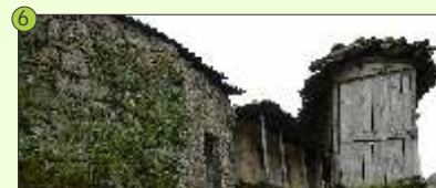
6 San Salvador